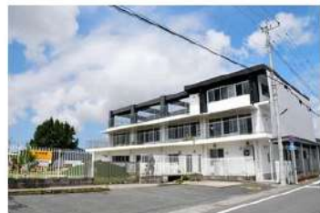
クラスターが発生した城山保育園=2021年9月8日、熊本市西区

熊本市西区の幼保連携型認定こども園「城山保育園」で、職員14人と園児65人の計79人が新型コロナウイルスに感染し、クラスター（感染者集団）と認定された。同園では、子どもに表情を見せることが大事だとして職員のマスク着用が徹底されていないなど、感染対策が不十分だったことが、市の調査で明らかになった。